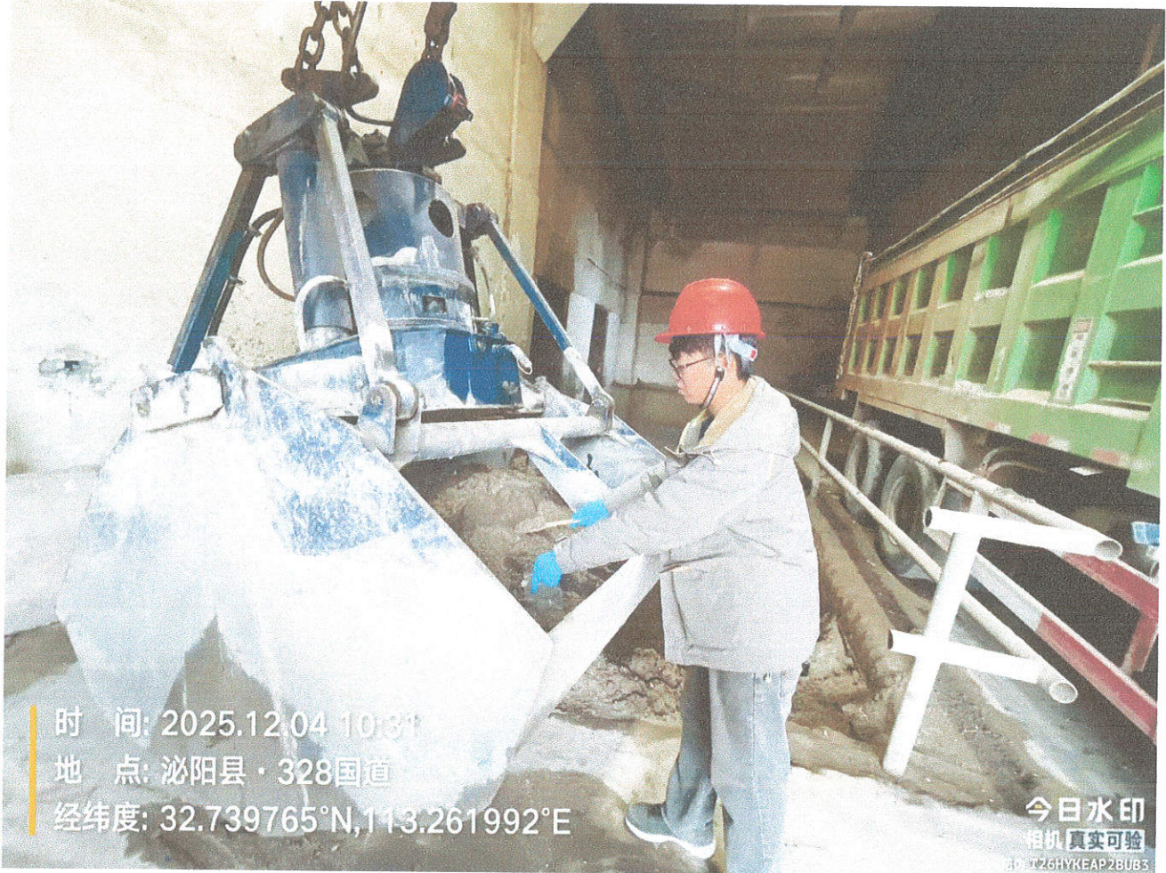
附件：现场采样照片